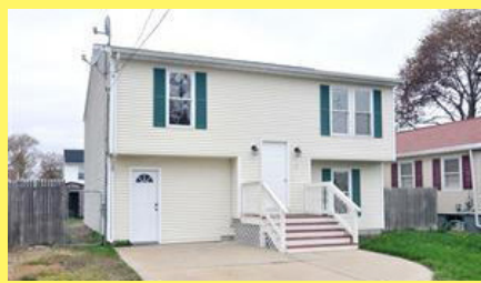
Raised Ranch EAST PROVIDENCE $229.900