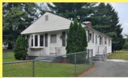
Ranch CUMBERLAND $239.900