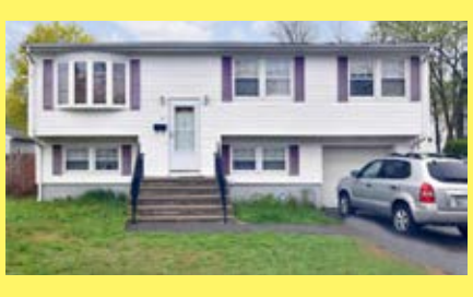
Raised Ranch EAST PROVIDENCE $239.900