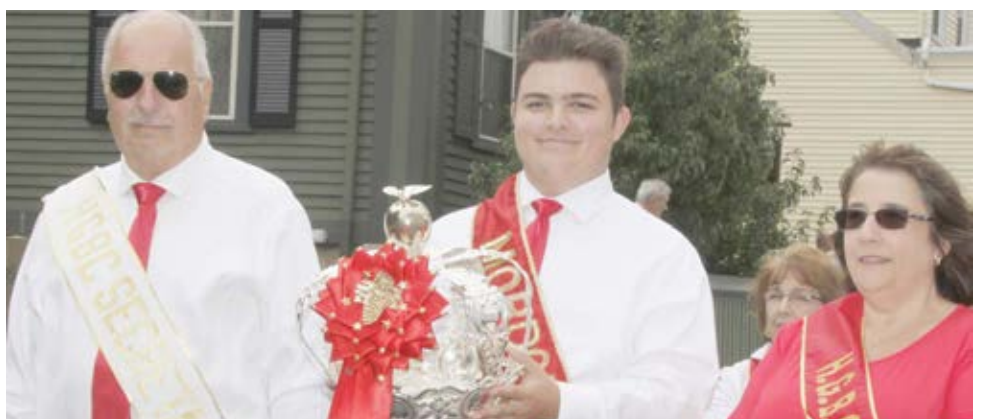
Irmandade do Espírito Santo do Brightridge Club, East Providence