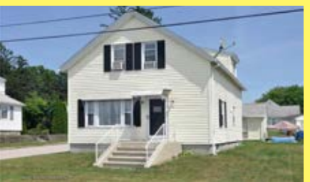
Cottage EAST PROVIDENCE $199.900