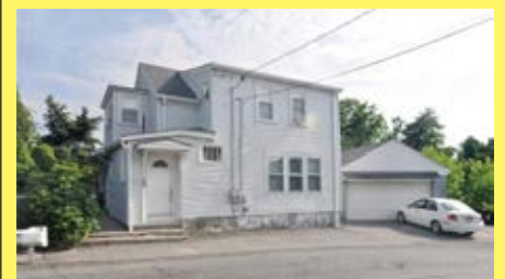
2 Moradias CUMBERLAND $149.900