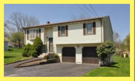
Raised Ranch EAST PROVIDENCE $309.900