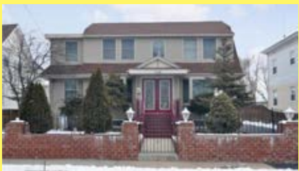
Colonial EAST PROVIDENCE $359.900