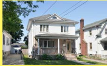
Colonial EAST PROVIDENCE $239.900