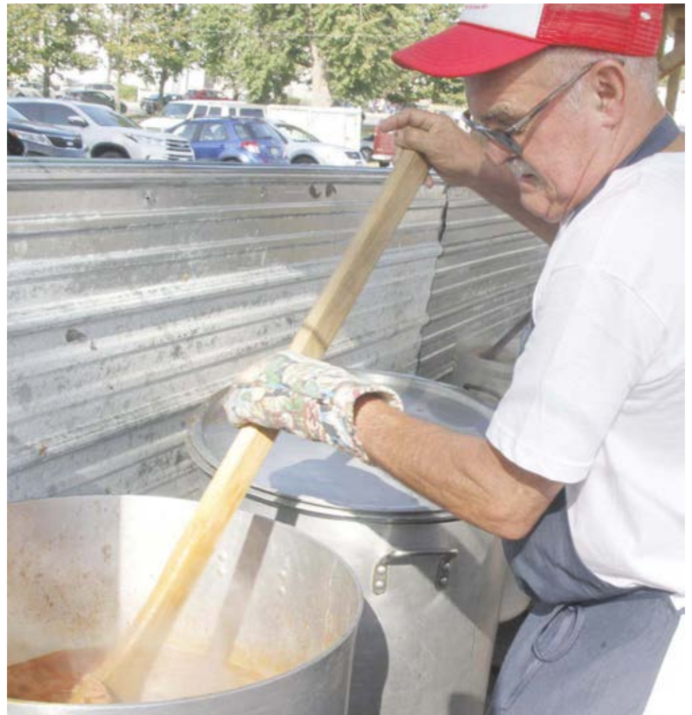
Grande parte do sucesso das Grandes Festas do Espírito Santo da Nova Inglaterra deve-se à componente gastronómica, cujos pratos tradicionais constam da caçoila, linguiça, favas, frango assado e as apetitosas malassadas, tudo excelentemente confeccionado por um numeroso grupo de voluntários que não tem mãos a medir.