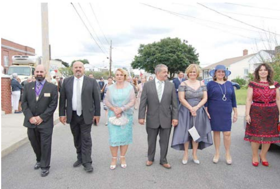
Fotos referentes às festas de São Vicente de Paulo de 2018