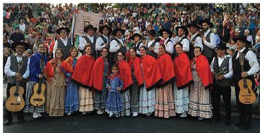
Rancho Folclorico de Santo Antonio de Pawtucket