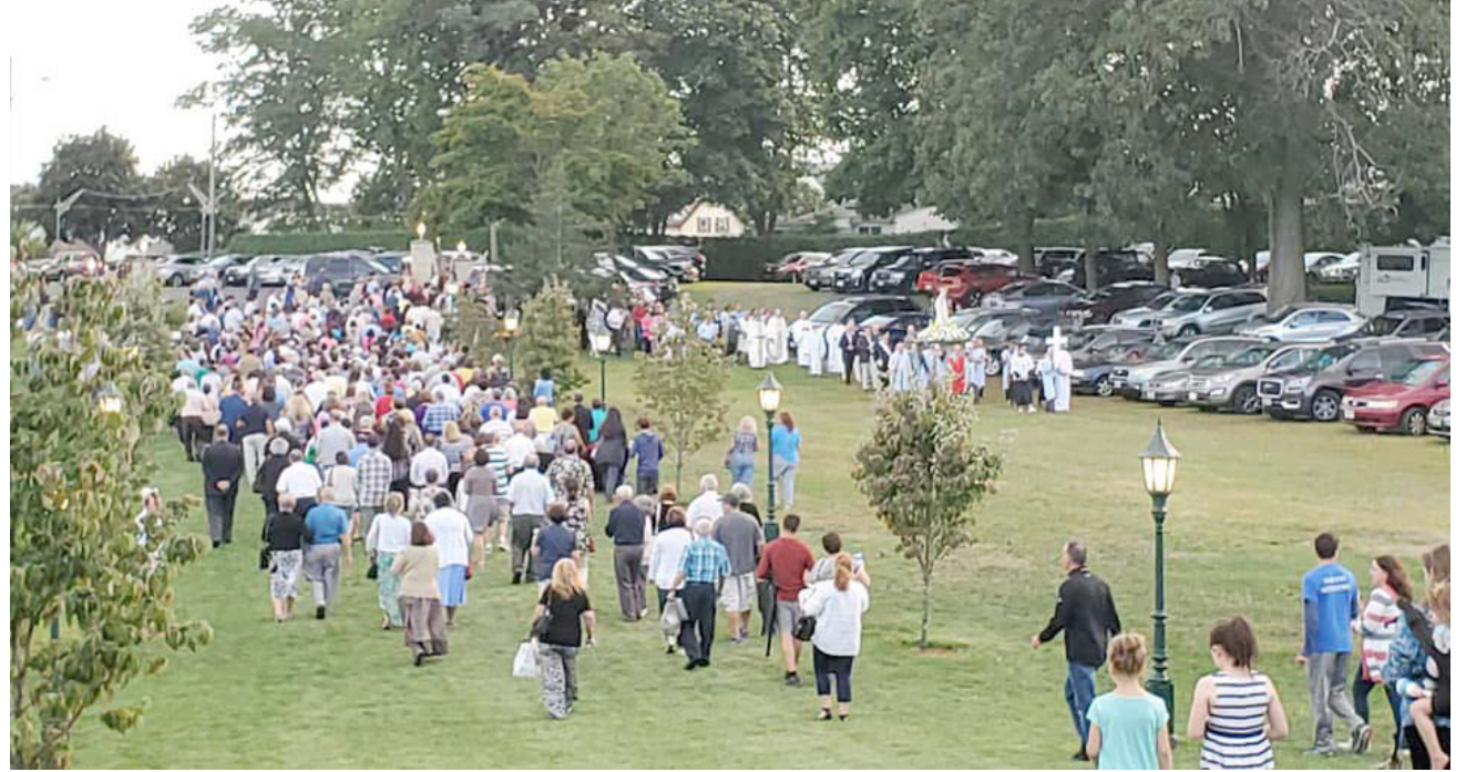
As fotos documentam vários aspectos da procissão ao Santuário de Nossa Senhora de Fátima em Cumberland.

Senhora de Fátima, pode estar orgulhoso pelas festividades, pelas alterações, contributivas do êxito conseguido.