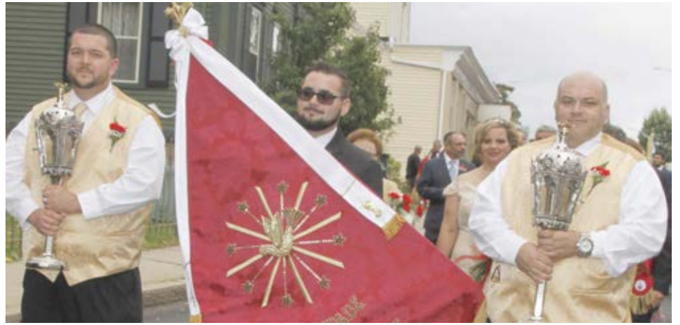
Irmandade do Senhor Bom Jesus da Vila de Rabo de Peixe, East Providence