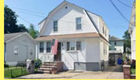
Colonial EAST PROVIDENCE $249.900