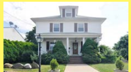
Colonial EAST PROVIDENCE $299.900