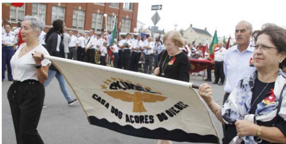
Representantes da Casa dos Açores de Quebec, Canadá