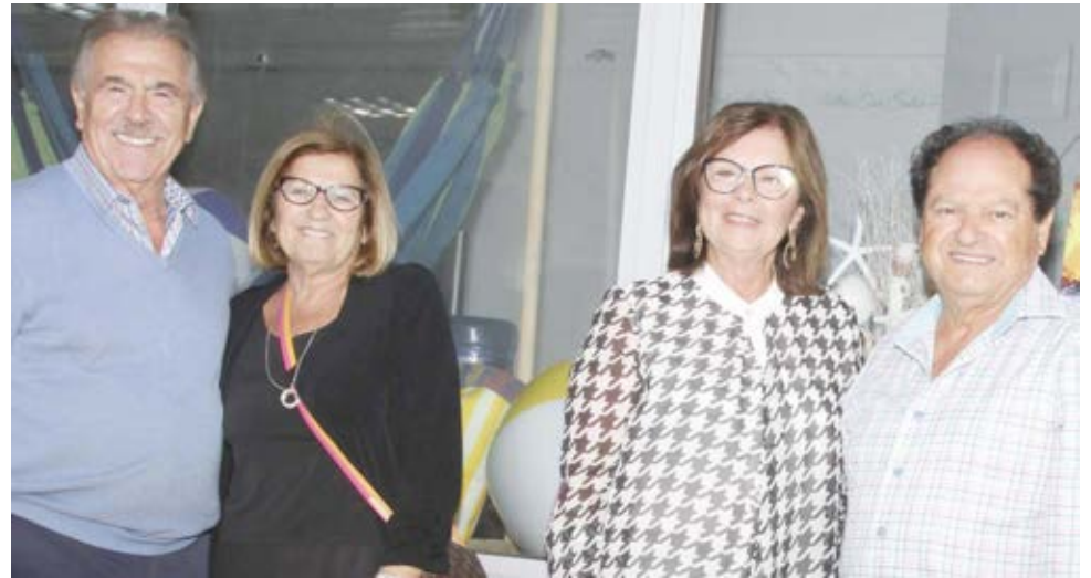
As famílias Salema e Andrade são apoiantes das Grandes Festas