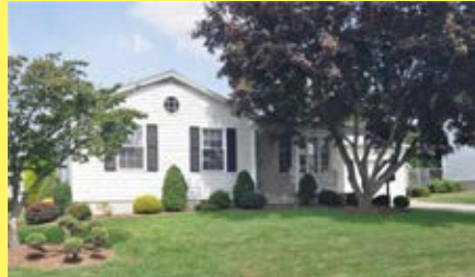
Ranch EAST PROVIDENCE $319.900