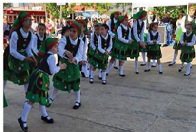
Discovery Language Academy Folkloric Performance Group