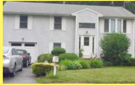
Raised Ranch RIVERSIDE $289.900