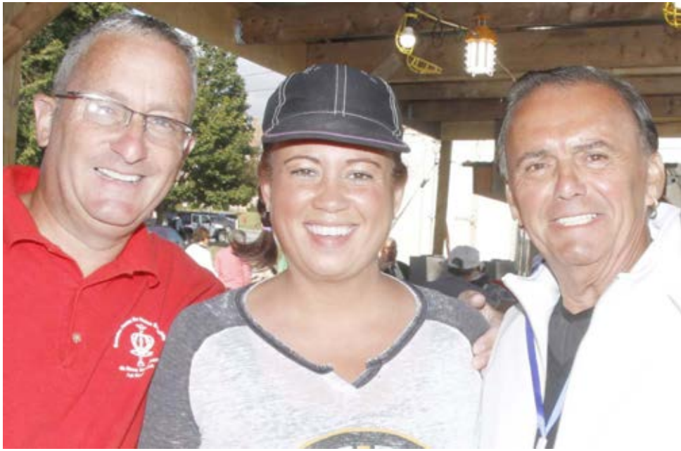
Segunda geração de apoiantes às Grandes Festas que o fazem em respeito e memória pelos pais.