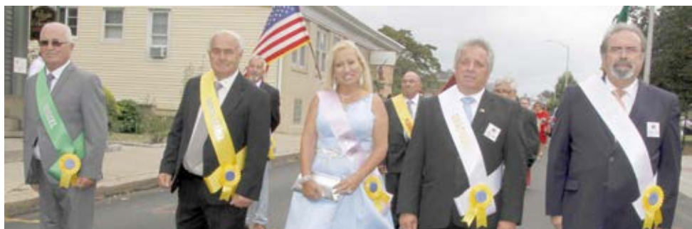
Representantes das 9 ilhas dos Açores na procissão de coroação das Grandes Festas do Espírito Santo da Nova Inglaterra