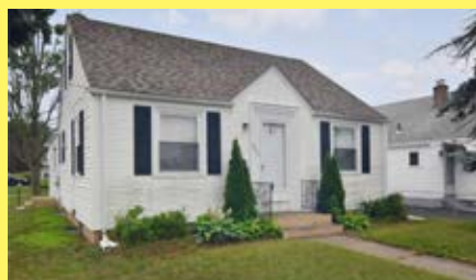
Cape PAWTUCKET $224.900