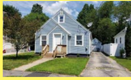
Cape EAST PROVIDENCE $259.900