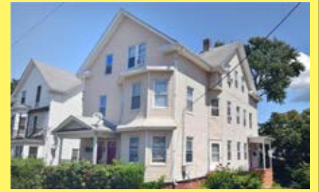
6 moradias PAWTUCKET $329.900