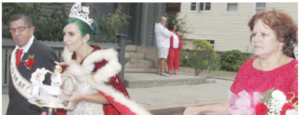
Irmandade do Espírito Santo de Nossa Senhora do Rosário, Providence