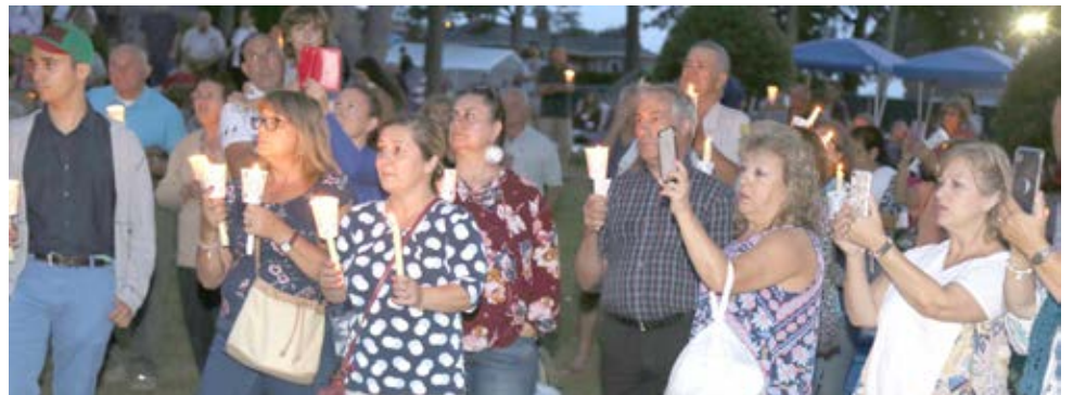
As fotos documentam as várias passagens das festas em honra de Nossa Senhora de Fátima de Ludlow vendo-se a multidão que tomou parte na homilia, na procissão de velas e a componente de entretenimento com destaque para o folclore.

Recentemente Fall River foi palco das Grandes Festas do Espírito Santo da Nova Inglaterra, onde um autêntico mar de gente também adere àquelas manifestações sócio-culturais traduzidas em mais de 200 mil pessoas. Com as duas componentes, religioso e popular, as festas de Nossa Senhora de Fátima são de grande relevo. O santuário de Nossa Senhora de Fátima em Ludlow pode considerar-se a imagem mais fidedigna da Cova da Iria na diáspora. São milhares de pessoas que anualmente ali convergem.