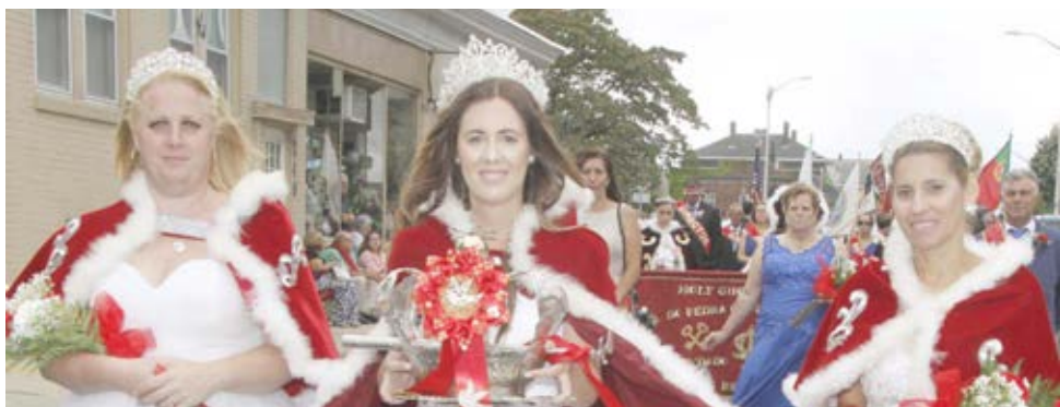
Irmandade do Espírito Santo do Phillip Street Hall, East Providence