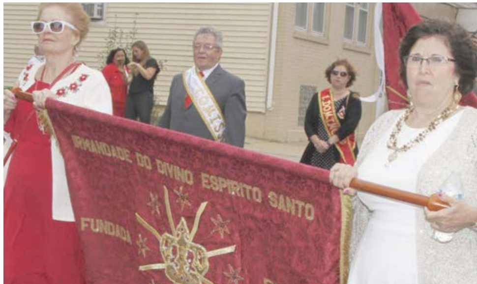
Irmandade do Espírito Santo de Nossa Senhora de Fátima, Cumberland