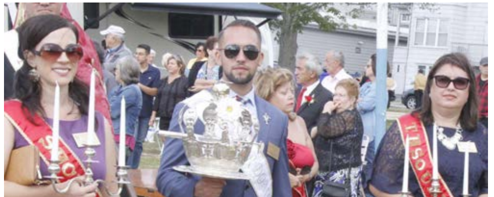
Irmandade do Espírito Santo da Igreja de Santo António, Pawtucket