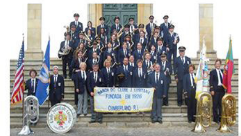
Banda do Clube Juventude Lusitana