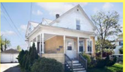
2 Moradias EAST PROVIDENCE $239.350