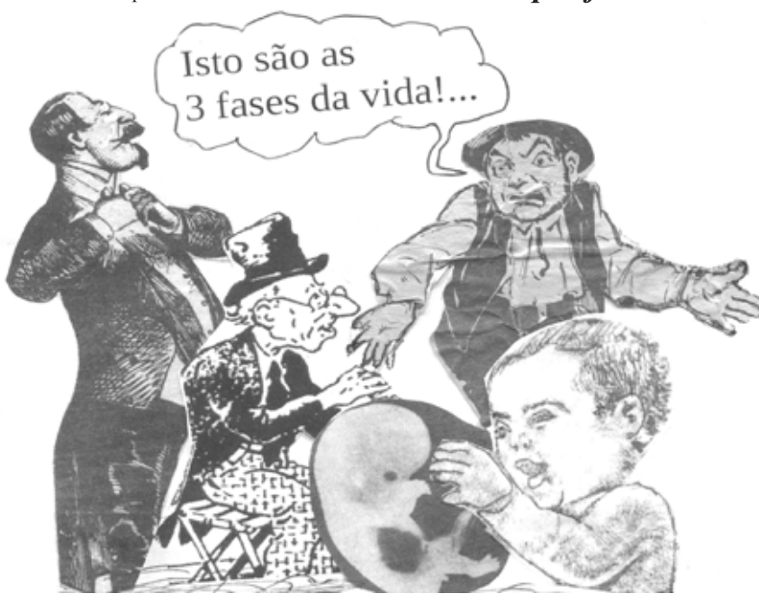
Publicado a 03 de setembro de 2015