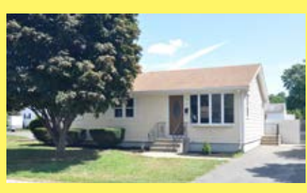
Ranch EAST PROVIDENCE $284.900