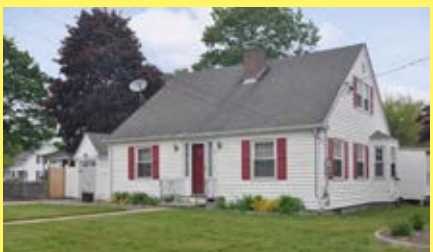
Cape RIVERSIDE $275.900