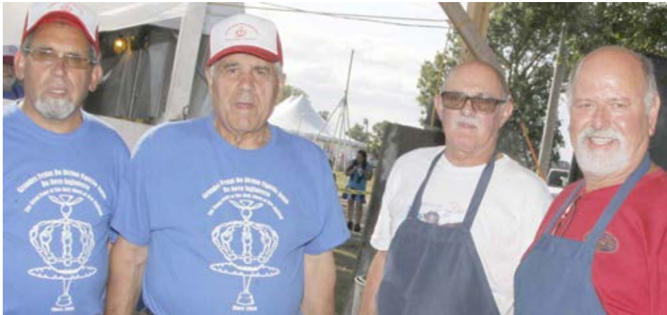
A cozinha para estes não tem segredos. Das favas à caçoila tudo sai para satisfazer as milhares de pessoas que acorrem ao Kennedy Park durante os cinco dias festivos.