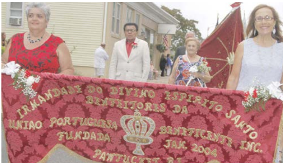
Irmandade do Espírito Santo da União Portuguesa Beneficente, Pawtucket