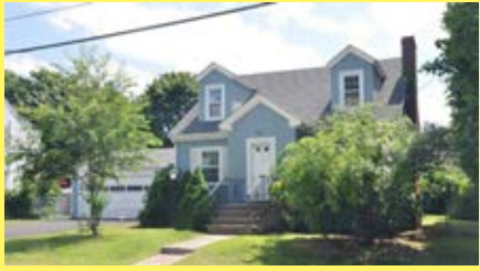
Cape RIVERSIDE $299.900

• Várias casas à venda • Preços baixos • Juros continuam baixos