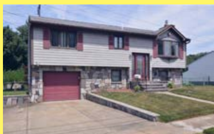
Raised Ranch EAST PROVIDENCE $309.900